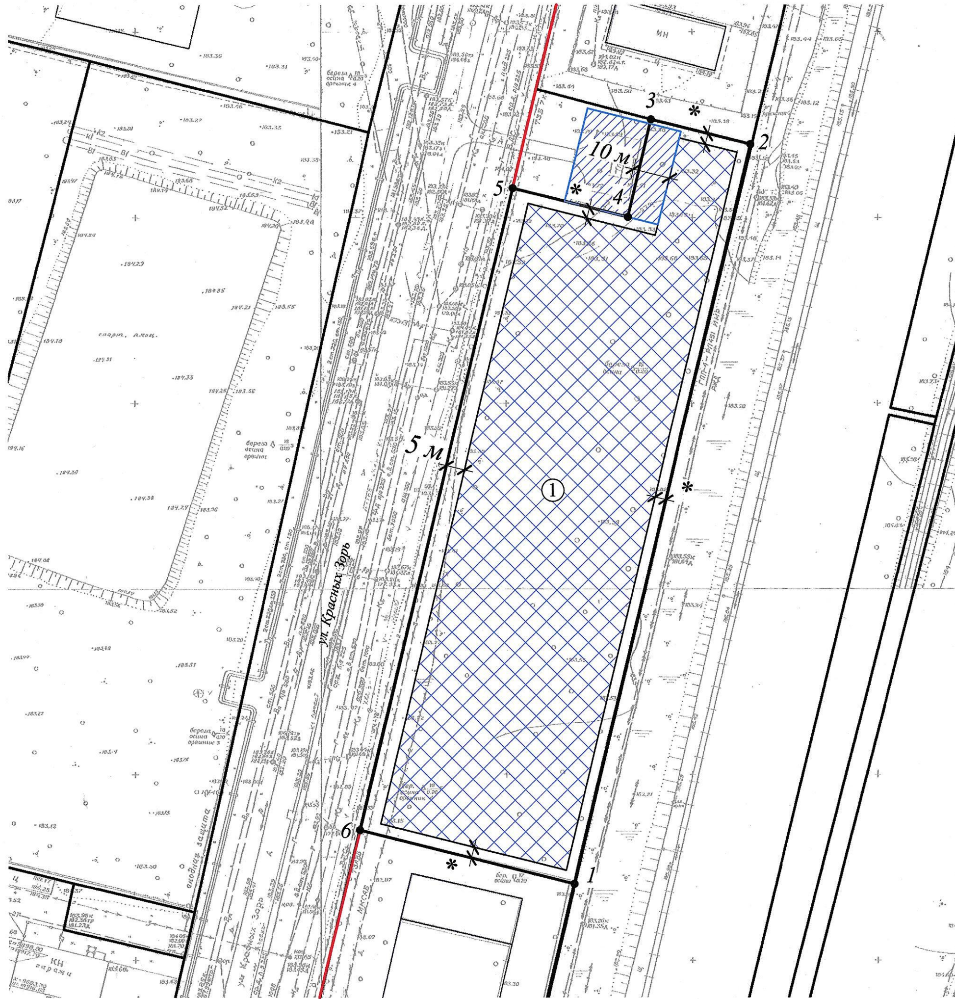
Схема чертежа градостроительного плана земельного участка с кадастровым номером 40:27:030803:88